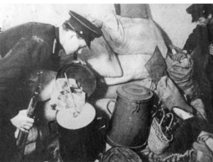
Rendőrök kutatják az elrejtett élelmiszert egy falusi kamrában, 1951. március

Ezt követően egy 16 holdas középparaszt 1951. augusztus 11-én belépett a tszbe, majd tizenhat hozzá hasonló, már valamivel jobb módú paraszt is csatlakozott a „közöshöz”, akik jelentős földterületet és eszközállományt is magukkal vittek. Ez szintén felzúdulást keltett a faluban. A tömeges belépés háttérben azonban az állt, hogy a gazdák nagy része nem volt képes egyedül megtermelni a beadási kötelezettségben előírt terményeket. Persze, ezek mennyiségét eleve úgy határozták meg,